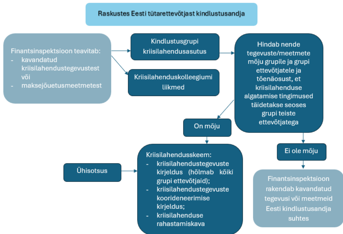
Joonis 3. Kriisilahendus tütarettevõtjast kindlustusandja korral

Lõige 1. Kui kindlustusgrupi tütarettevõtjast kindlustusandja on makseraskustes või sattumas makseraskustesse või tütarettevõtjast kindlustusandja või muu kriisilahenduse subjektiga seoses on kriisilahenduse algatamise tingimused täidetud, teavitab FI kriisilahendusüksus sellest viivitamata kindlustusgrupi kriisilahendusasutust, kindlustusgrupi järelevalve teostajat ja teisi asjakohaseid kriisilahenduskolleegiumi liikmeid. Teavitada tuleb ka kavandatavatest kriisilahendustegevustest või maksejõuetusmenetluse meetmetest, mida on asjakohane rakendada.